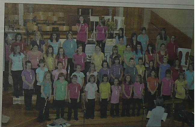
Un agréable concert présenté par la chorale Les Rossignols.

Que des éloges donc pour les responsables et les choristes pour cette réussite.